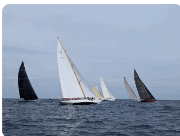
Pré World 12mJI