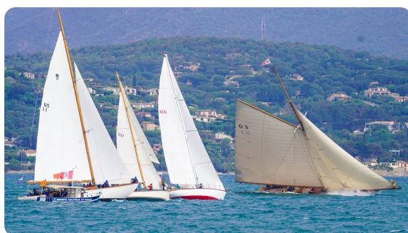
Dames de Saint-Tropez