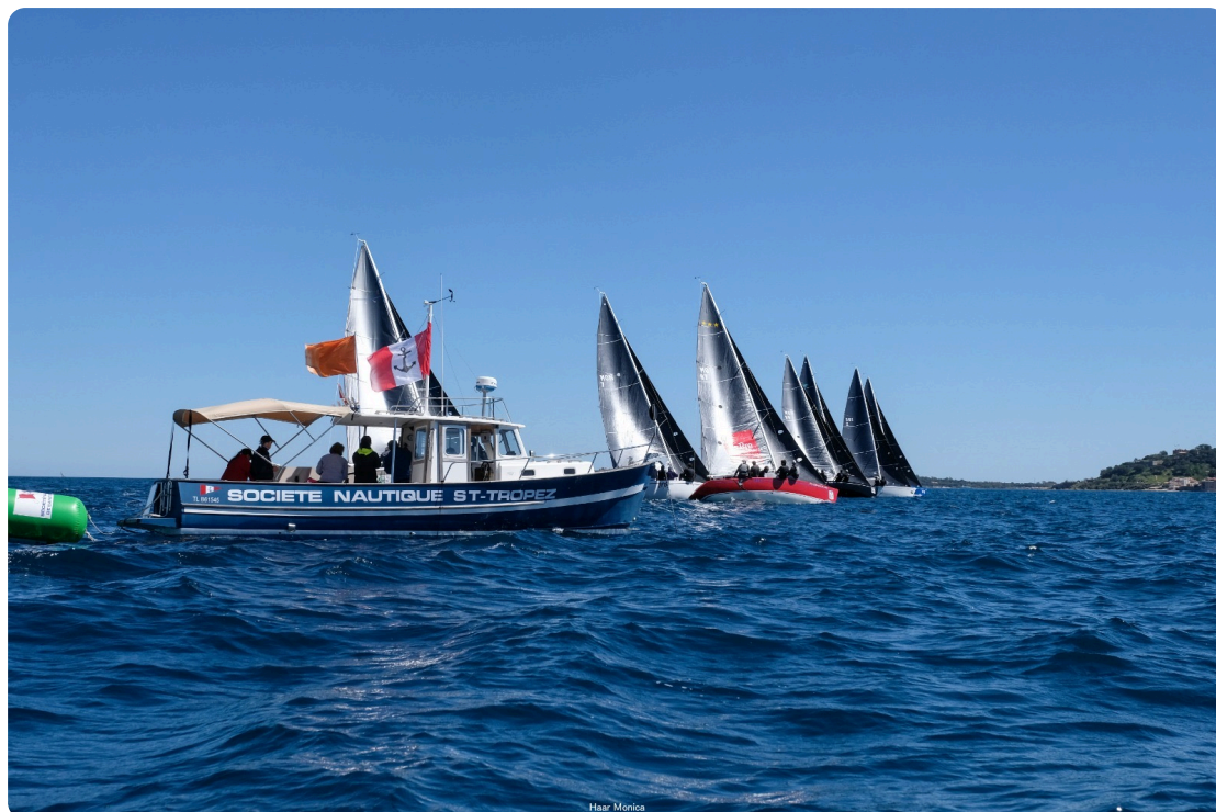
PAPREC 600 Saint-Tropez

Retrouvez toutes les actualités sur notre site internet ainsi que les PHOTOS des événements ICI