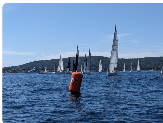
Régate des Bravades