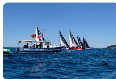
Coupe de l'Hippocampe