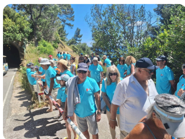
SORTIE CLUB 1

Les horaires d'été vous seront communiqués ultérieurement.