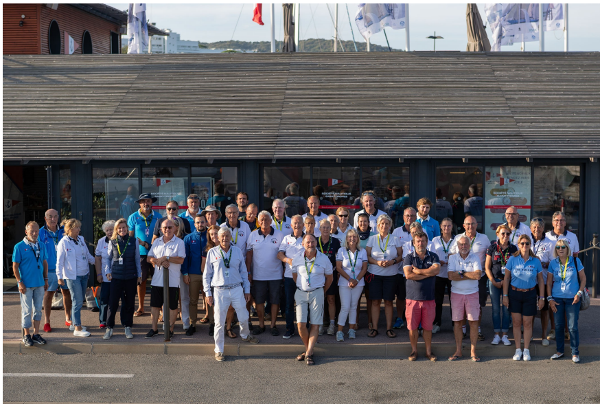
Photo prise après un briefing du Comité Course

Un immense merci à l'ensemble des bénévoles