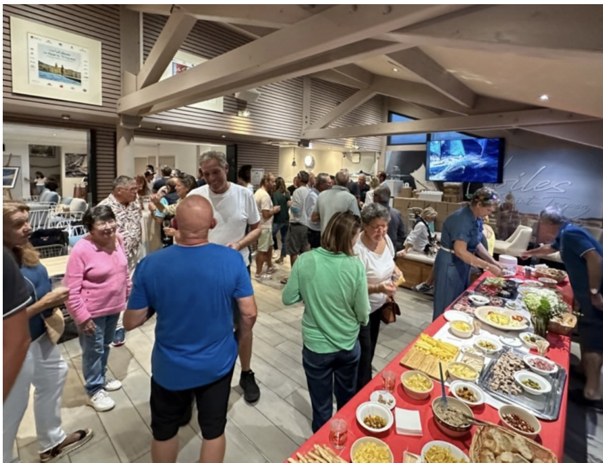
Photo prise lors du pot de remerciement le vendredi 13 octobre