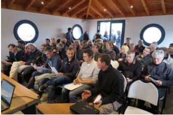
Le briefing des skippers