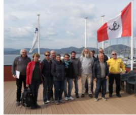
Le comité de course