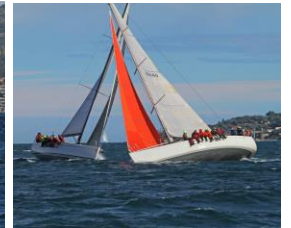
ALBACOR 4 / PEN KALET