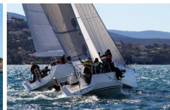
ECBAT ANE à Gauche