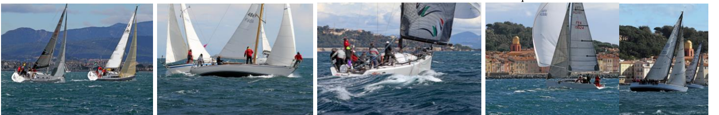
Le vainqueur 2016 BOOMERANG