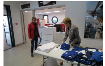
Les préparations avec le comité de course, le contrôle sécurité des voiliers, la distribution des polos North Sails