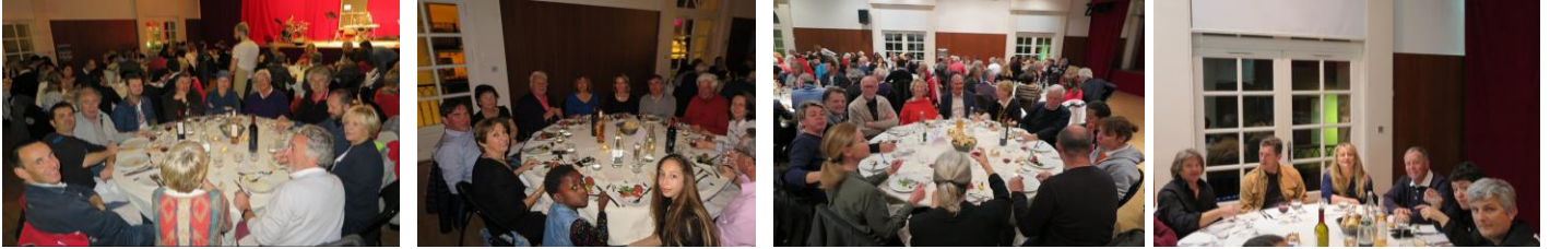
Le team CHILI PEPPER