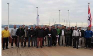
Les skippers des équipages