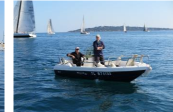
Quelques spectateurs et bateaux dont la SNSM pour suivre le départ des voiliers lancé le 12 mars à 12h !