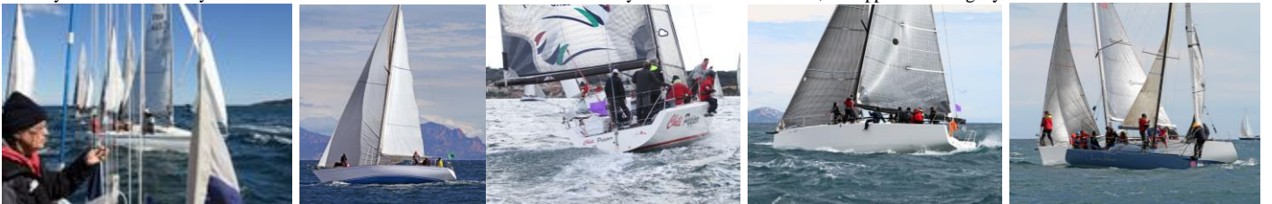
Mireille E du Comité course. Quelques voiliers SNST : SOLANO, CHILI PEPPER