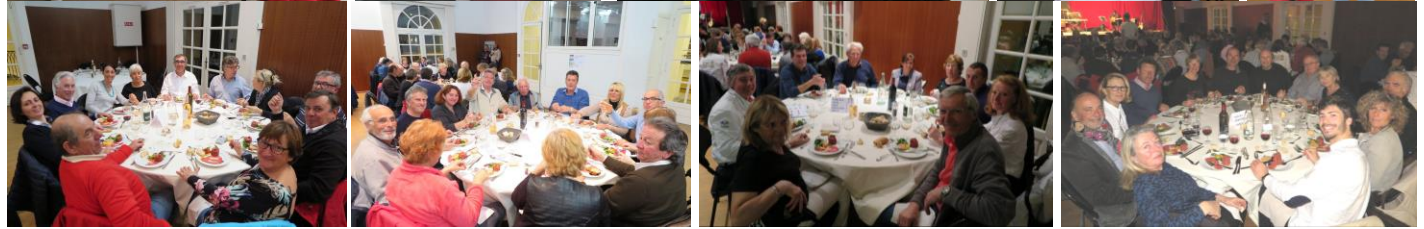
Equipages JADE et NATALIA