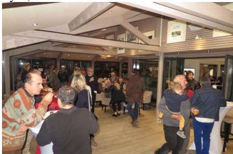
Beaucoup de monde à la Soirée et un grand succès pour les crêpes