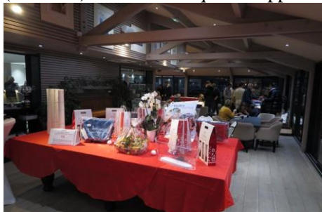
Les lots de la Tombola