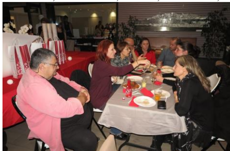
A table !!