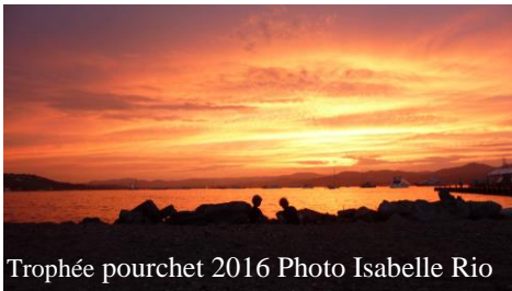
Trophée pourchet 2016