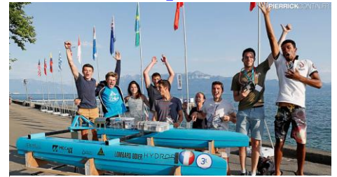
Centrale Nantes, équipe gagnante de l'HydroContest 2016 en catégorie « bateaux légers »

Comme depuis la création de la manifestation en 2013, la France, nation la plus titrée au palmarès de l'Hydrocontest, sera, cette année encore, la délégation la plus représentée avec 9 écoles engagées : Centrale Supélec, Ecole Centrale de Nantes, Université Le Havre Normandie, ENSM Marseille, Ecole Polytechnique & ENSTA, SeaTech Toulon, Université de Montpellier, ESTIA Bidart et ENS Mines de Paris.