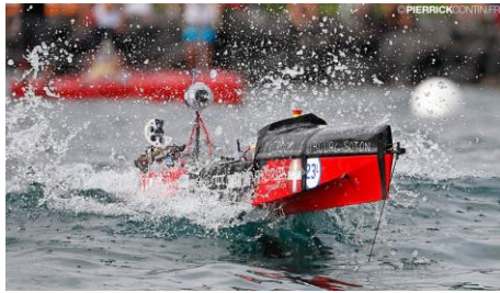
Bateau léger de l'EPFL, vainqueur du classement s'établit en fonction du temps de parcours. prix de l'innovation en 2016