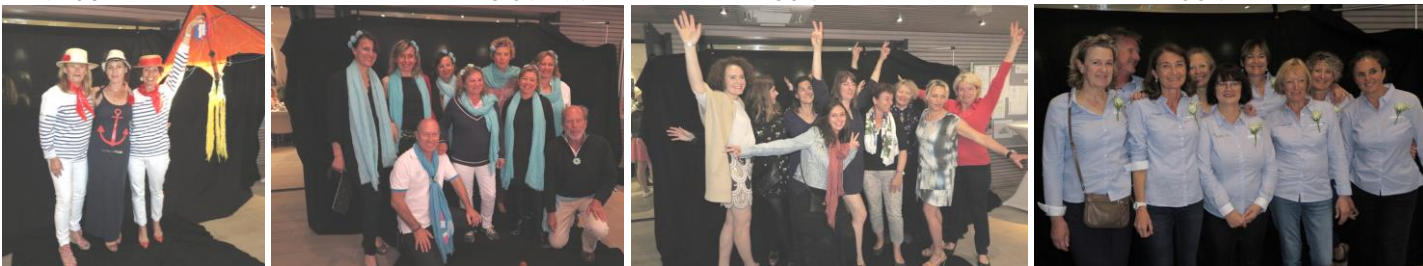
CERF VOLANT NAGAINA OISEAU DE FEU RATAFIA