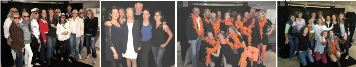
MANITOU MARIA GIOVANNA MOONBEAM III MOONBEAM IV