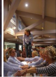
La soirée se poursuit à la SNST