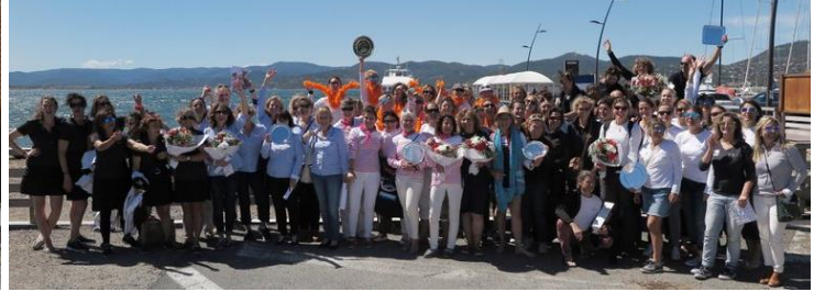
Les vainqueurs 2017