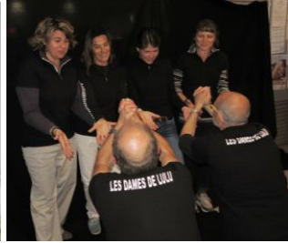
LES DAMES DE LULU