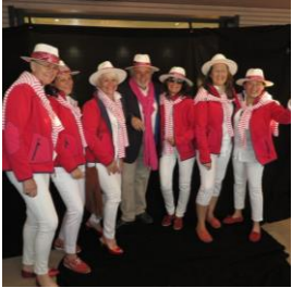
ENTRE CIEL ET MER