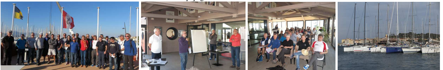
Les « coureurs de la Transquadra » Briefing et annonce du parcours. Les voiliers en lice. Après l'accalmie du Mistral, départ retardé à 18h30