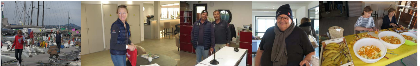
A terre les vérifications contrôle sécurité des bateaux et préparation de la soirée des équipages avec les bénévoles