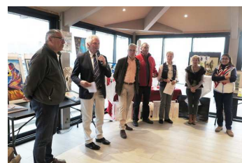
Photo de l'événement 2017 : https://goo.gl/photos/k2ovcejBt8VN1i5z6

Résultats en ligne sur le site SNST : http://www.societe-nautique-saint-tropez.fr/snst/evenements/le-festival-armen/#tab-id-1