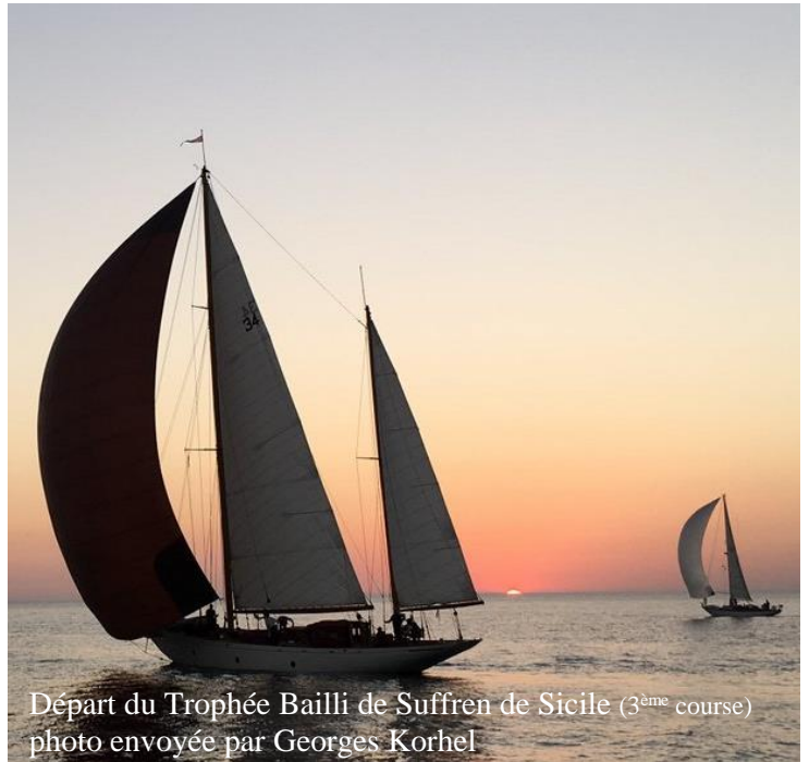
Départ du Trophée Bailli de Suffren de Sicile (3 ème course)