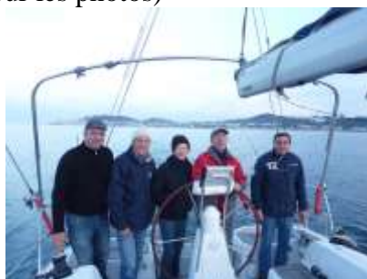
l'équipe en mer est prête