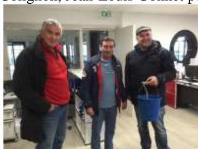
Avant le départ