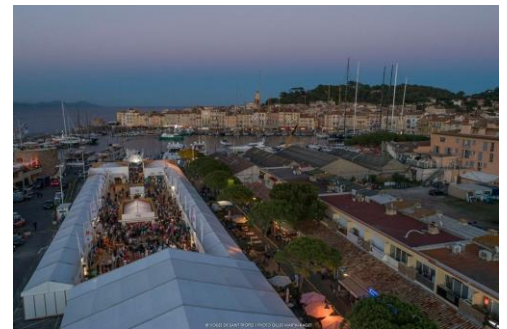
Rédaction Maguelonne Turcat . Photos : DR et Gilles Martin-Raget

A l'occasion des 20 ans de l'épreuve, la Société Nautique de Saint-Tropez a souhaité mixer les surprises en faisant appel à l'un des DJ les plus en vue de la Côte d'Azur : le très réputé Jack-E, animateur vedette des Caves du Roy, a été convié mardi soir au village pour fêter l'événement.