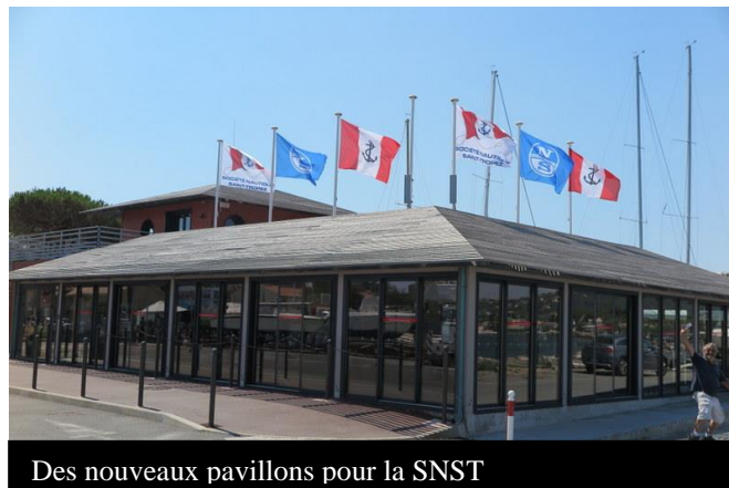
Des nouveaux pavillons pour la SNST