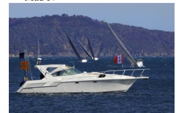
Le bateau comité Clemzy