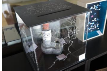
L'œuvre d'art vainqueur – Jobic 4