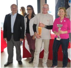
Vainqueur groupe CIM