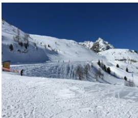
André B et les concurrents à l'épreuve de ski à Isola 2000 avec des conditions idylliques.