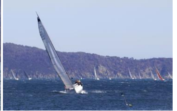
Arrivées à Cavalaire