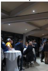
Soirée festive et dansante