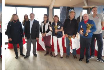
Groupe IRC 1&2