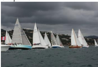
Flotte au départ