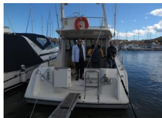
Flotte au départ

Résultats sur le site SNST : http://www.societe-nautique-saint-tropez.fr/snst/evenements/le-festival-armen/#tab-id-1