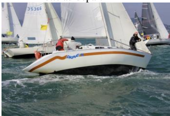
La grand vainqueur Dione