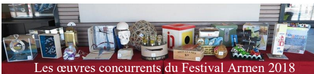
Les œuvres concurrents du Festival Armen 2018