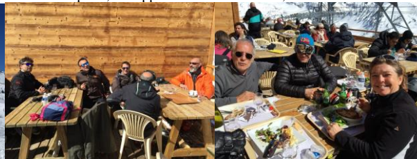
Pause déjeuner en altitude