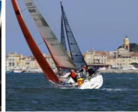
En mer, la soixantaine de voiliers a offert un beau spectacle