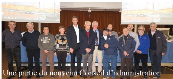
Une partie du nouveau Conseil d'administration

Les résolutions ont été approuvées à l'unanimité sauf celui du renouvellement des membres de la commission interne.