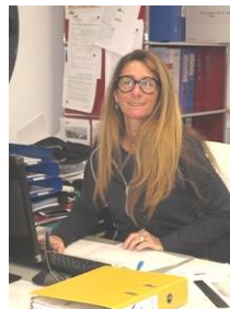
Les inscriptions Frédérique