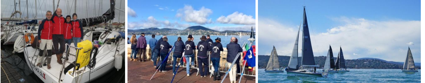
L'équipe de Star du X avant le départ. Départ vue du comité, du Môle Jean Reveille