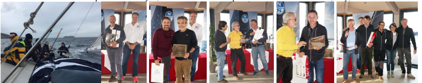
Obsession avant son abandon Firsty 4, 1 er duo. Marcher sur l'eau 2 ème duo. Telemaque, 1 er solo. Walili, 2 ème solo. Patitifa 1 er équipage