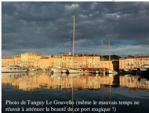
(même le mauvais temps ne réussit à atténuer la beauté de ce port magique !)