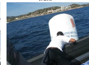
Mouillage avec le Nouveau semi-rigide de la SNST est arrivé et a été baptisé « on off »