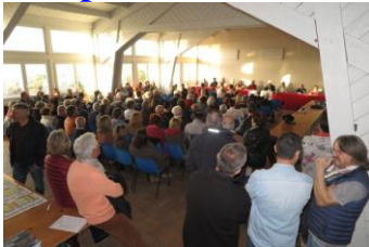
Beaucoup de membres étaient présents